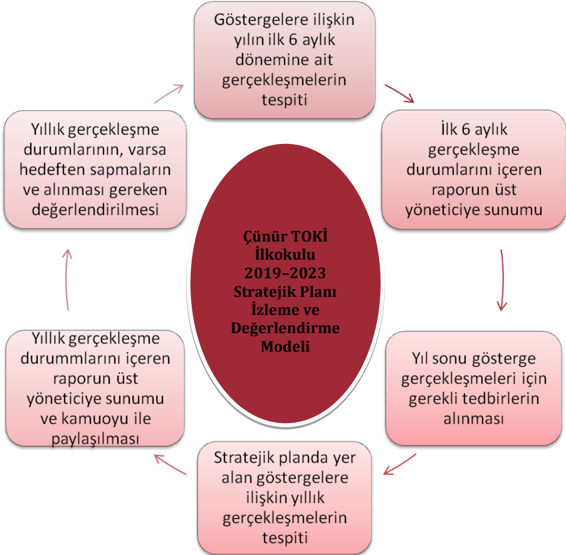
Şekil 3: İzleme ve Değerlendirme Modeli